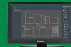
Visor de mapas