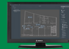
Програма перегляду карт