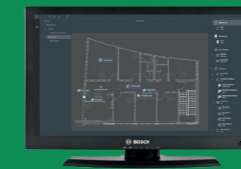
Visualizador de mapas