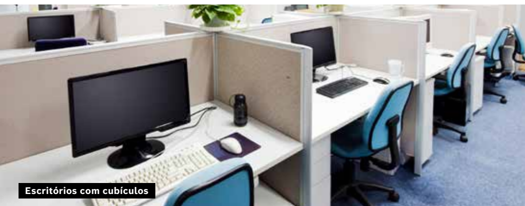
Escritórios com cubículos