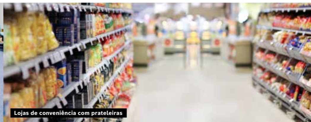
Lojas de conveniência com prateleiras